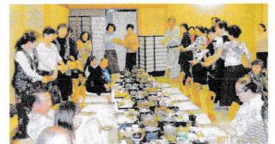
芸達者連の花笠音頭

帰りのバスは、幹事さんのガイド、ビンゴゲームとおしゃべりで楽しい二日を過ごさせていただきました。