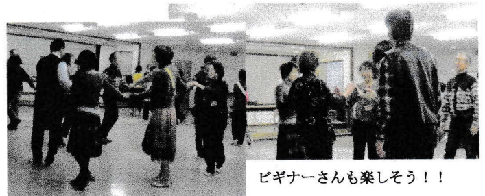
ビギナーさんも楽しそう!! 卒業を間近に控え余裕の笑顔